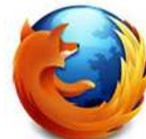
ファイヤーフォックス