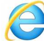
インターネット エクスプローラー